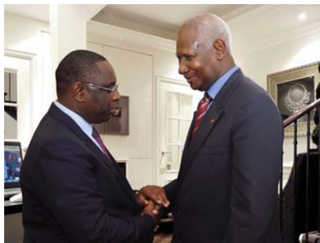
Abdou Diouf, Secrétaire Général de l'OIF a évoqué avec le PR Macky Sall, la candidature du Sénégal pour accueillir le XV È Sommet de la Francophonie à Dakar

Le 14 È sommet de l'Organisation Internationale de la Francophonie se tiendra à Kinshasa, en République Démocratique du Congo, les 13 et 14 octobre 2012, sur le thème « Francophonie : Enjeux environnementaux et économiques face à la gouvernance mondiale ».