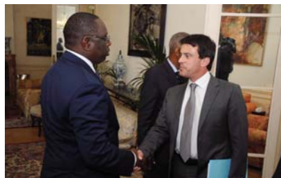
Le Ministre de l'intérieur, Manuel Valls recue en audience par le PR Macky SALL

Lors de la rencontre avec le Ministre délégué chargé du Développement, Monsieur Pascal CANFIN, l'appui de la France à la réalisation de divers projets dont ceux relatifs à la délocalisation de la prison centrale de Rebeuss ainsi qu'à la construction d'une Ecole Nationale de Magistrature au Sénégal a été sollicité. Sur l'ensemble de ces questions, il a été convenu de la signature d'un nouveau document cadre de partenariat sur trois (3) ans, où seront définis tous les axes prioritaires de la coopération entre les deux pays.