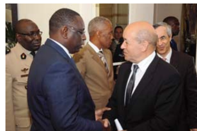
Le Ministre de la Défense, Jean-Yves le DRIAN recue en audience par le PR Macky SALL.

La coopération militaire entre les deux pays a occupé une bonne partie des discussions avec le Ministre de la Défense, Monsieur Jean-Yves Le DRIAN.