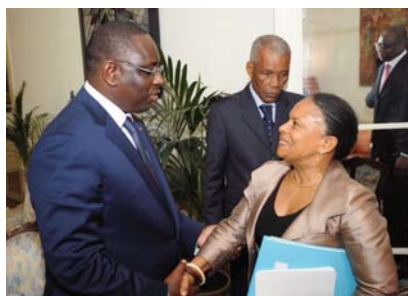
Le Ministre de la Justice, Madame Christiane TAUBIRA recue en audience par le PR Macky SALL.

L'audience avec le Ministre de la Justice, Madame Christiane TAUBIRA a été mise à profit pour aborder les modalités d'une collaboration entre le Sénégal et la France en vue de rapatrier les fonds indûment soustraits à notre pays.