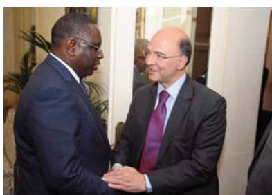
Le Ministre de l'Économie et des Finances, Pierre Moscovici, reçu en audience par le PR Macky SALL.

La coopération économique entre la France et le Sénégal s'ouvre une nouvelle ère. Le Sénégal vient en effet de bénéficier de la France d'un appui budgétaire de 130 millions d'euros, au moment où un regain d'intérêt pour la destination « Sénégal » relance les opportunités d'investissement français au Sénégal. Cela constitue une bonne nouvelle pour l'économie sénégalaise qui vient de s'engager dans la voie d'un redressement durable. Le réchauffement de l'axe Paris-Dakar profite ainsi des