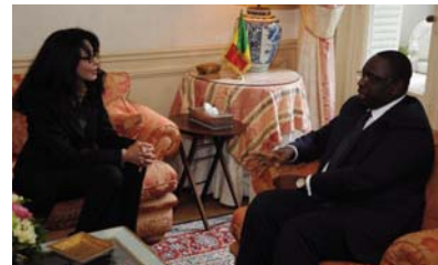
Le Ministre de la francophonie, Mme Yamina Benguigui recue en audience par le PR Macky Sall.

Avec le Ministre délégué en charge de la Francophonie, Madame Yamina BENGUIGUI, les discussions ont porté sur le prochain Sommet de la francophonie à Kinshasa.