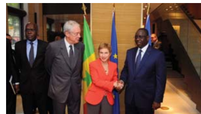
Une délégation du MEDEF conduite par sa Présidente Madame Laurence PARISOT recue en audience par le PR Macky SALL.

Par ailleurs, sur le plan économique le Chef de l'État a rencontré, le 06 juillet 2012, une délégation du Mouvement des Entreprises de France (MEDEF) conduite par sa Présidente Madame Laurence PARISOT. Lors de cette rencontre, le Président de la République a décliné la nouvelle dynamique qu'il entend insuffler à l'environnement des affaires au Sénégal axée sur la bonne gouvernance.